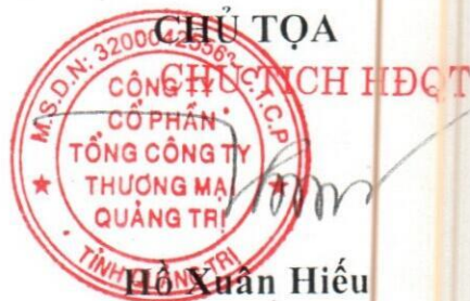
Hồ Xuân Hiếu